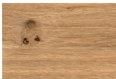
Wildecke massiv, soft gebürstet