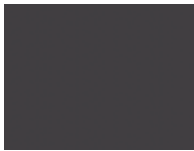
Pulverbeschichtung, carbonfarbig für Fussgestelle