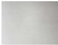
Galvanisierung, nickelfarbig für Fussgestelle