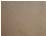
Pulverbeschichtung, bronzefarbig für Fussgestelle